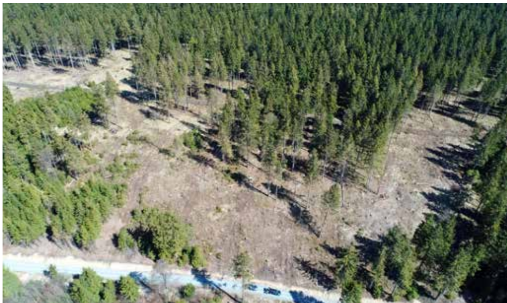
| Während der Borkenkäfer-Schadholzanfall landesweit rückläufig ist, frisst sich der Schädling, wie hier im fichtenreichen Forstamt Neuhaus, regional begrenzt weiter durch.

Erfurt | Seit Juni sinken die durch Borkenkäferbefall entstandenen Schadholzmengen in Thüringens Wäldern.